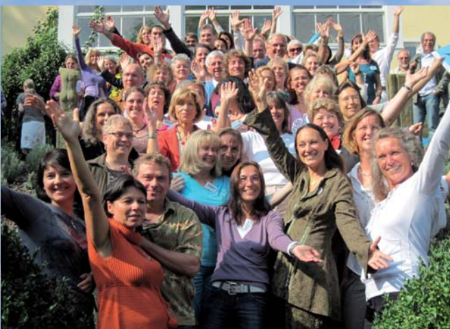
Beste Stimmung bei den Mitwirkenden der Heilertage 2009

Wohin geht die Reise, wenn alle Fixpunkte und Horizonte nicht mehr gültig sind? Das Leben geht mit uns in die Kurve. Und wo andere eine Krise sehen, sehen wir die Chance, dass das Leben uns zwingt, unser Verhalten zu ändern. Das tut es auf allen Ebenen. Und das Paradigma der neuen Zeit, des wirklichen "new age", das als spirituelle Bewegung der politischen und ökonomischen Bewegung 40 Jahre voraus war, heißt: Do ut des! (Ich gebe, damit du gibst.) Leben in Kommunikation und Leben im Respekt gegenseitiger Abhängigkeit und Verantwortung.